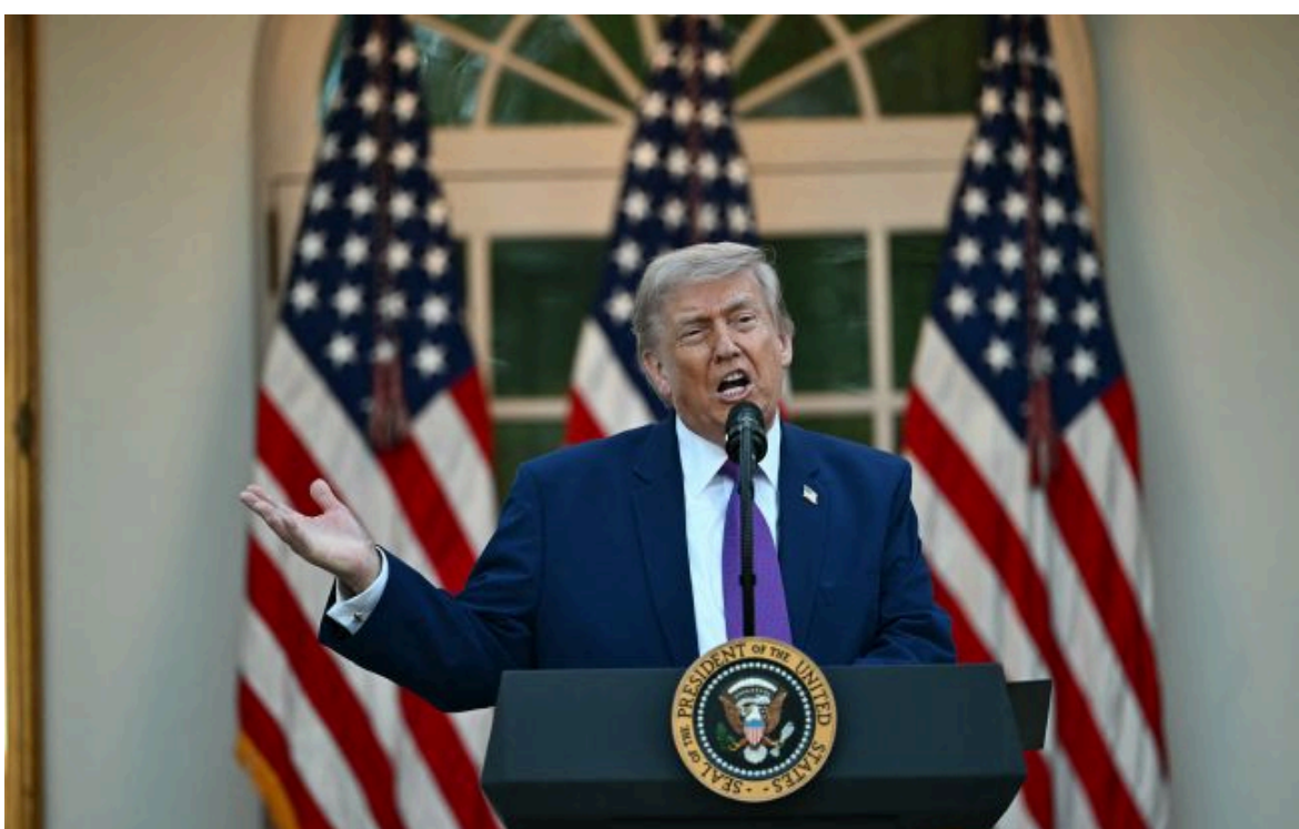
Фото: Дональд Трамп (Gettyimages)

Вимкни хаос міжнародних новин! Отримуй тільки важливе з РБК-Україна у Google