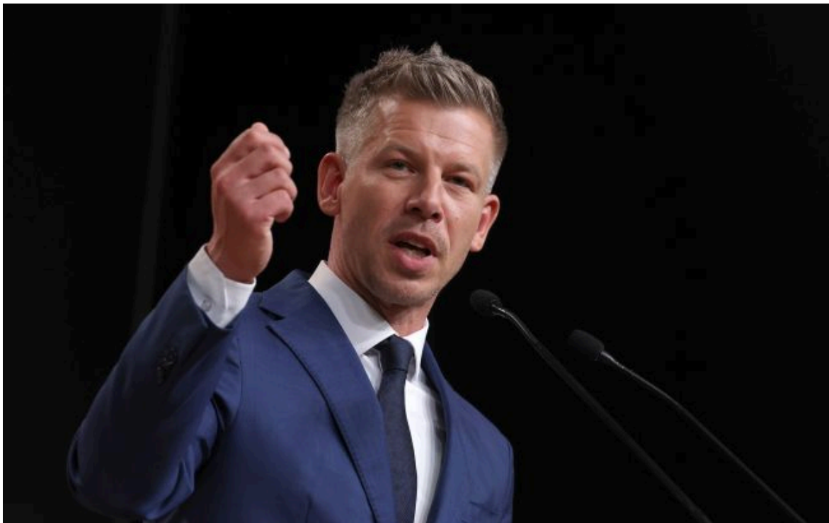
фото: прем'єр-міністр Угорщини Петер Мадяр

Вимкни хаос міжнародних новин! Отримуй тільки важливе з РБК-Україна у Google