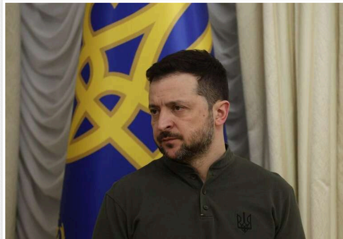
РФ готує нову мобілізацію до 100 тисяч осіб, Україна посилює далекобійні заходи, - Зеленський

У РФ готують нові мобілізаційні кроки – до 100 тисяч осіб. Україна ж готує розширення географії наших далекобійних санкцій.