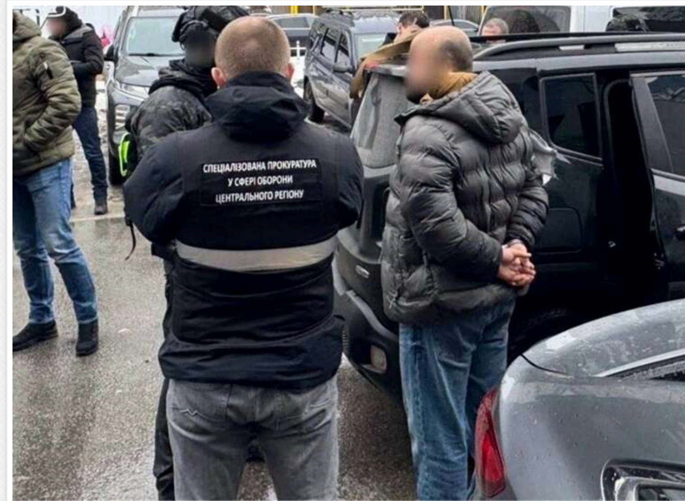
У Києві судитимуть ексчлена ДФТГ за «організацію» тилової служби за 13 тисяч доларів

У Києві судитимуть колишнього члена добровольчого формування територіальної громади, який за неправомірну вигоду обіцяв організувати службу в тиловій частині.