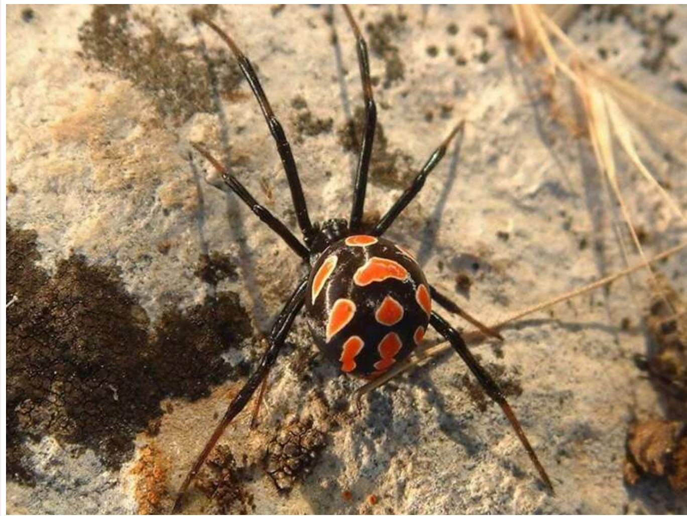
В Україні поширюється каракурт: експертка пояснила ризики «чорної вдови»

З приходом тепла в Європі активізуються небезпечні для людини види павуків. В Україні також фіксують розширення ареалу каракурта – павука з роду так званих чорних вдов.