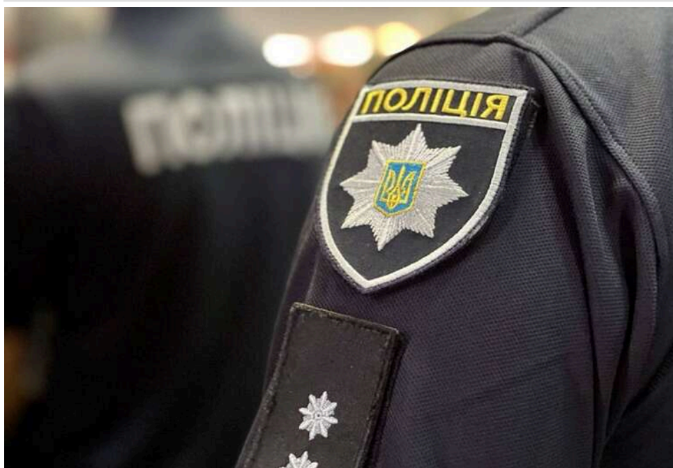
На Буковині судитимуть чоловіка за продаж гранат і боєприпасів, – поліція

Буковинські поліцейські перекрили канал незаконного обігу боєприпасів, вибухових речовин і пристроїв. Протиправну діяльність 38-річного жителя Одеської області задокументували оперативники Управління карного розшуку ГУНП в Чернівецькій області спільного з колегами обласного управління СБУ та слідчими Чернівецького районного управління поліції в рамках комплексу заходів із протидії незаконному обігу зброї, боєприпасів і вибухових речовин. Обвинувальний акт відносно фігуранта скеровано до суду.