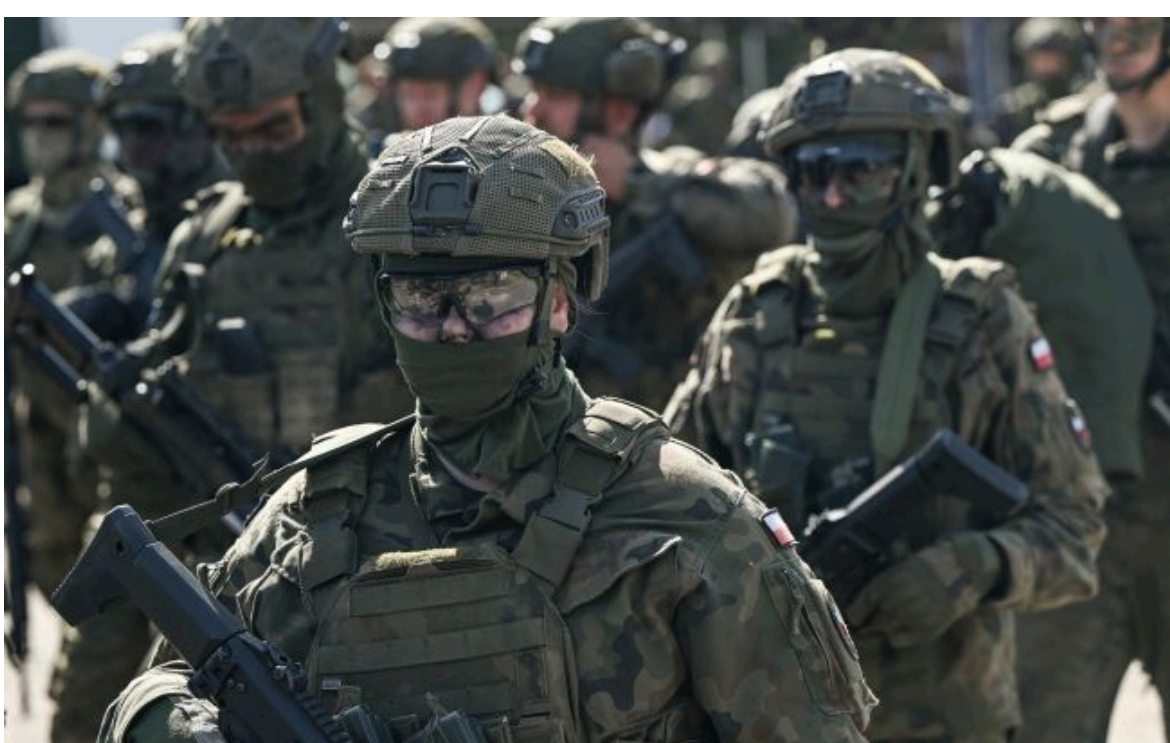
Фото: як Європа готується воювати без США

Не витрачай час на шум! Читай тільки суть з РБК-Україна у Google