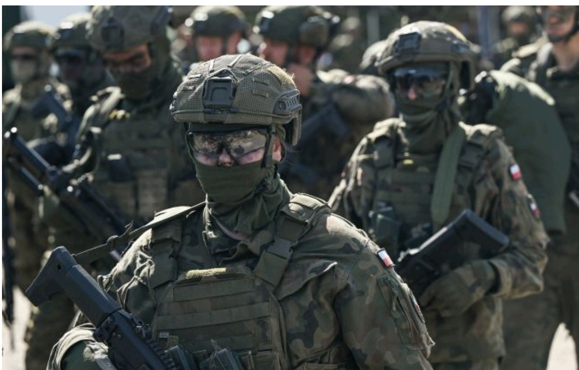
Фото: як Європа готується воювати без США

Не витрачай час на шум! Читай тільки суть з РБК-Україна у Google