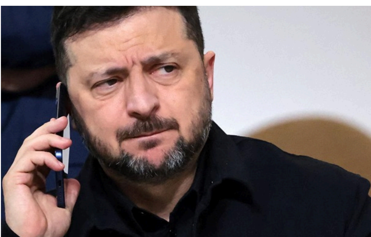
Зеленський обговорив з Вучичем двосторонні відносини

Глава держави вирішив відправити в Белград урядову делегацію на чолі з віцепрем'єром Тарасом Качкою.