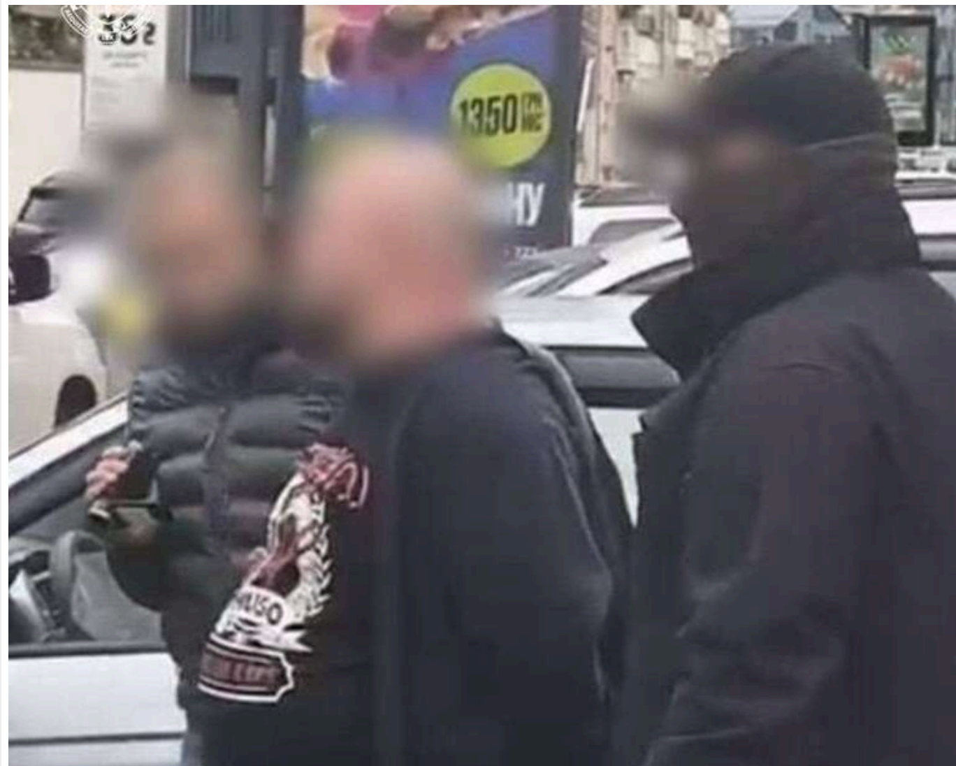
У Києві судитимуть чоловіка за «продаж» працевлаштування в правоохоронні органи за 25 тисяч доларів

У Києві судитимуть чоловіка за «працевлаштування» до правоохоронного органу за 25 тис. доларів.