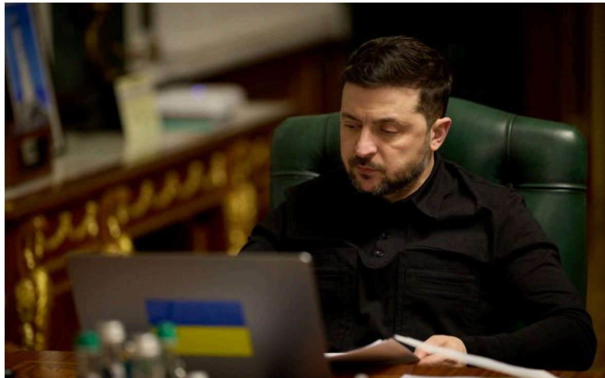
Фото: Володимир Зеленський, президент України (facebook.com_zelenskyy.official)

Не витрачай час на шум! Читай тільки суть з РБК-Україна у Google