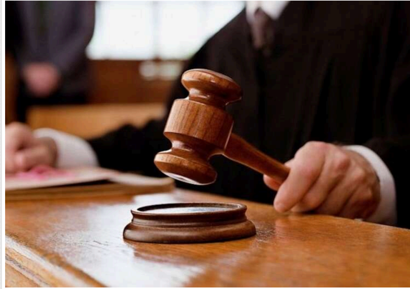
Суд в Одесі виніс вирок у справі про сутенерство та "квартиру для послуг"

У Приморському районному суді міста Одеси винесли вирок жінці, яку визнали винною у сутенерстві, повторному сутенерстві та створенні місця розпусу. Особливістю цієї справи – схему документували через серію контрольованих візитів правоохоронця під прикриттям, який кілька разів повертався до однієї й тієї ж квартири для збору доказів.