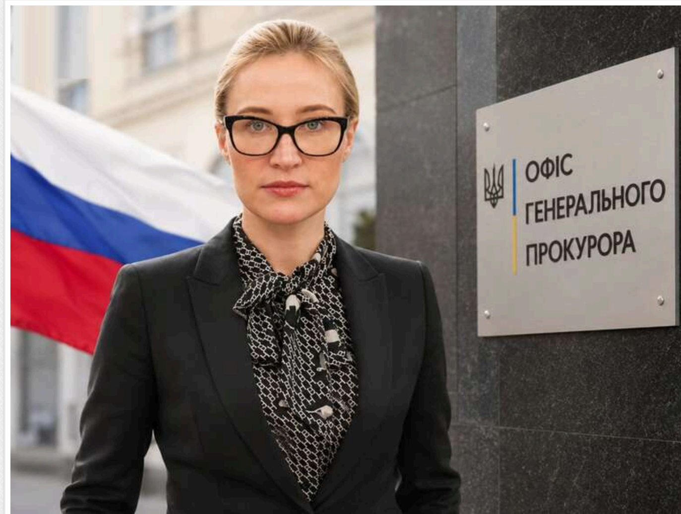
СБУ знищила документи щодо доступу до держтаємниці заступниці генпрокурора Вдовиченко

Нема документів - нема проблеми. Співробітники СБУ знищили документи щодо доступу до держтаємниці першої заступниці генпрокурора Марії Вдовиченко, рідний брат якої працює в прокуратурі РФ.