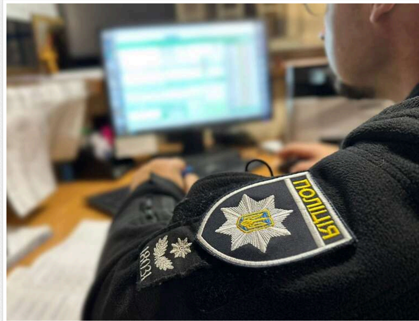
Справа «порноменів»: чому СБУ та ОГП затримали водія, але не чіпають заступників міністра МВС?

Генпрокурор Кравченко сьогодні повідомив про викриття схеми дахування порнографії в Україні. Виробники відеоконтенту платили абонплату керівництву поліції в Тернопільській, І-Франківській і Житомирській областях по $20 тисяч в місяць. Ще 5 тисяч доларів зверху брав водій одного з заміністрів МВС за те, що розвозив ці хабарі цим регіональним поліціантам.