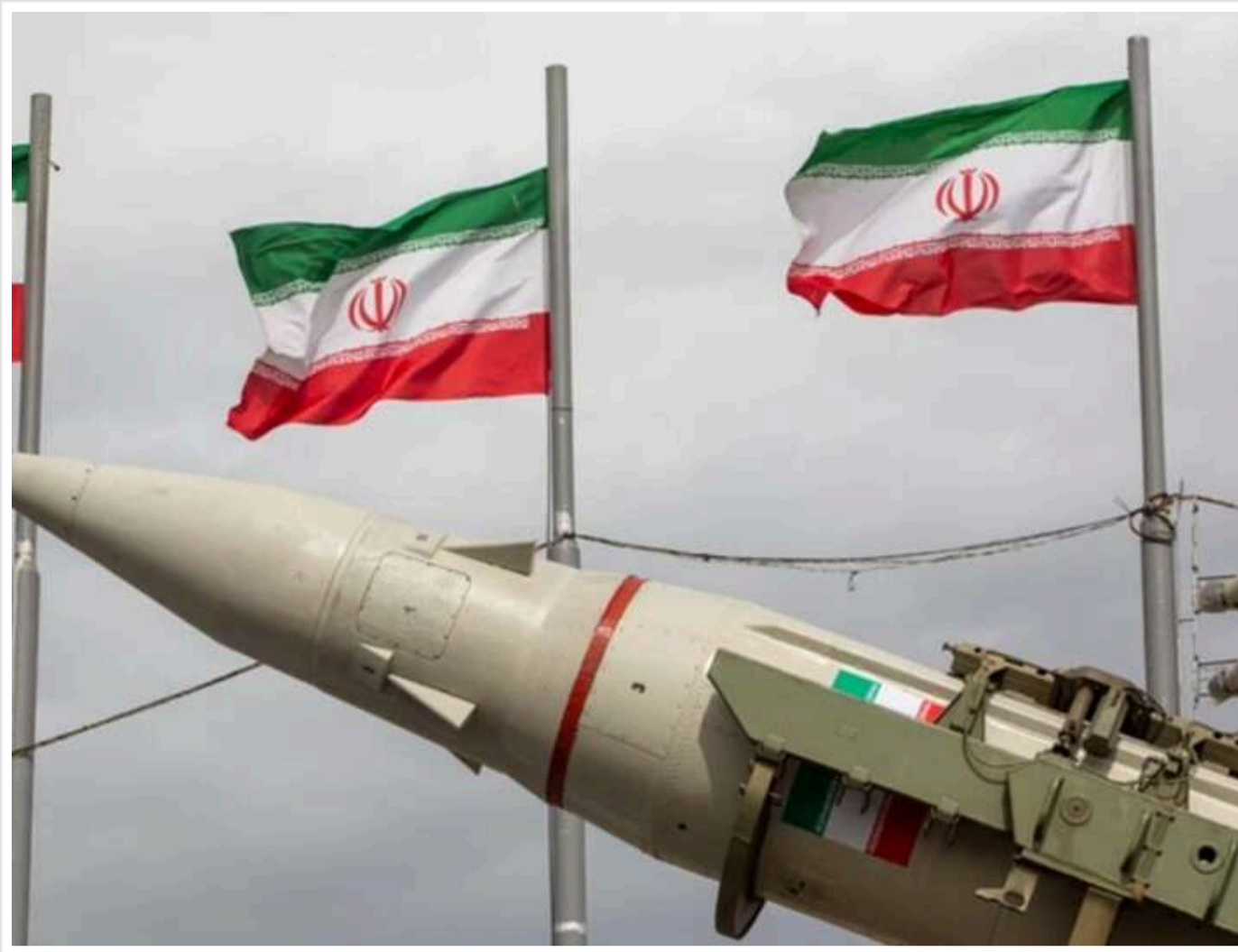
Іран пригрозив розширенням конфлікту за межі Близького Сходу у разі ударів США

Іран у середу, 20 травня, пригрозив поширити конфлікт за межі Близького Сходу в разі нової атаки з боку Сполучених Штатів після того, як американський президент Дональд Трамп сказав, що був за годину від відновлення військової кампанії.