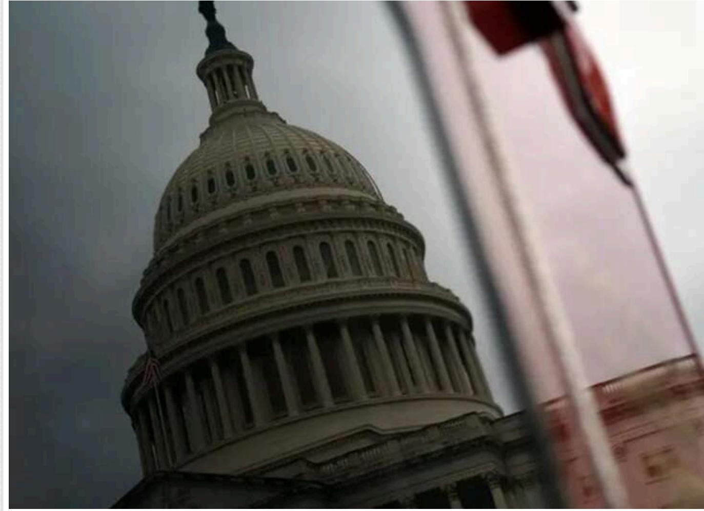
Reuters: США планують скоротити резерв сил, доступних для підтримки НАТО в Європі

Вашингтон планує суттєво скоротити резерв військових ресурсів, які США можуть задіяти для допомоги європейським членам НАТО у випадку масштабної кризи.