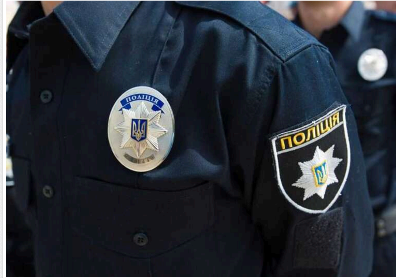
«Порноменти»: як топполіцейські трьох областей побудували мільйонний бізнес на «кришунанні» вебстудій

Порноменти. Як поліція в Україні заробляє на інтимних відео.