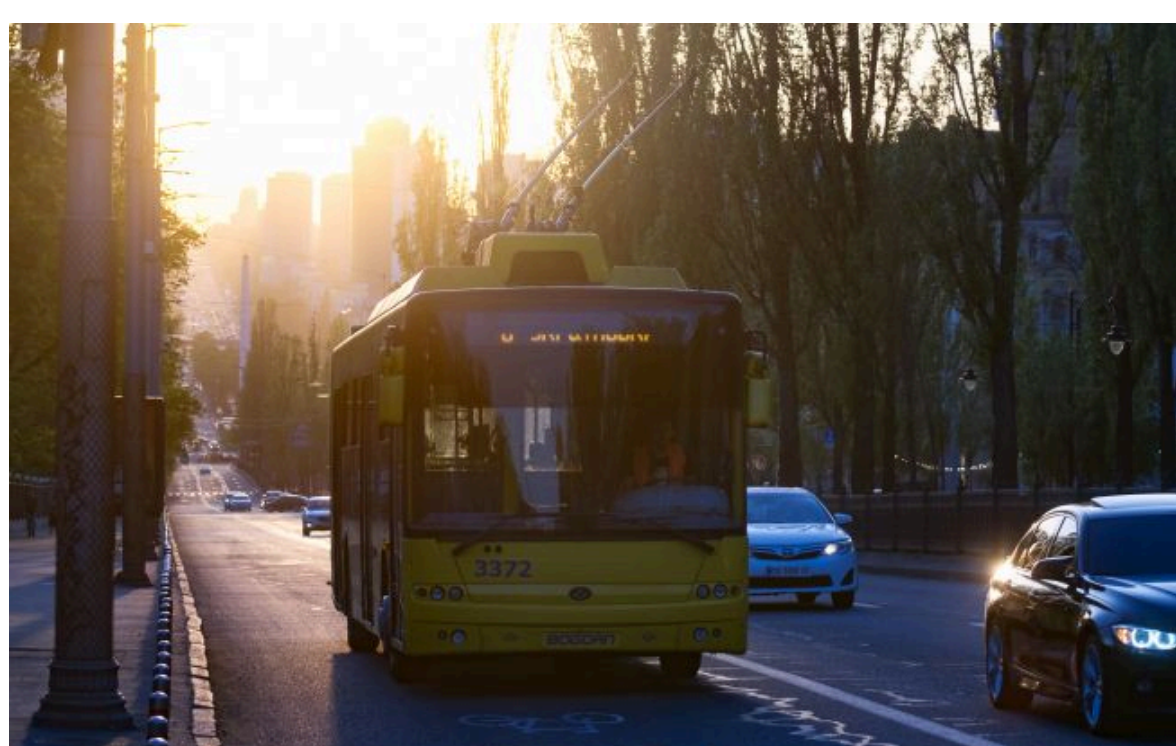
Проїзд у Києві безкоштовний для певних категорій