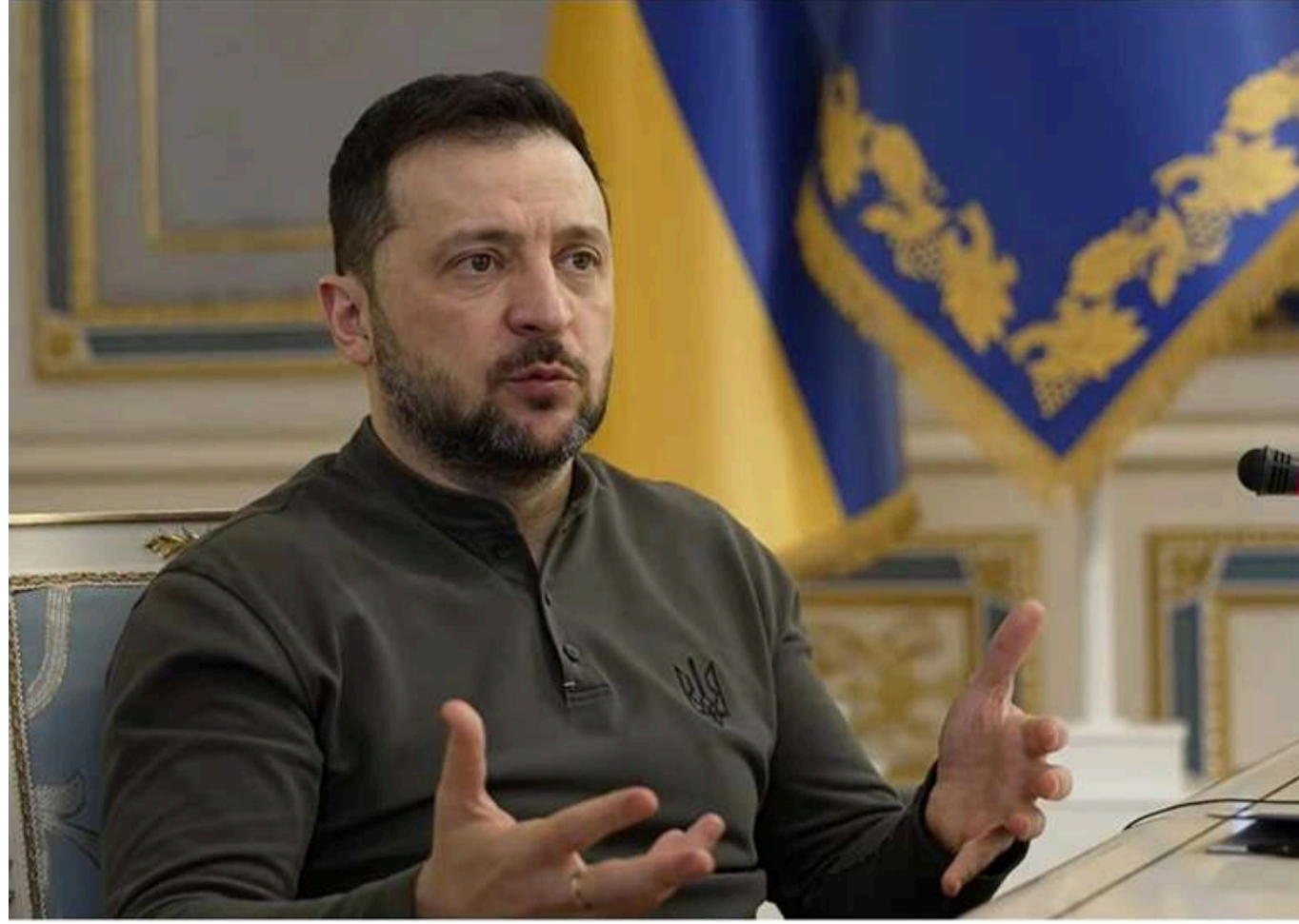
Зеленський запропонував відновити формат Е3 для мирних переговорів, — The Telegraph

Президент України Володимир Зеленський звернувся до Великої Британії, Франції та Німеччини, щоб відновити формат Е3 і використати його для мирних переговорів