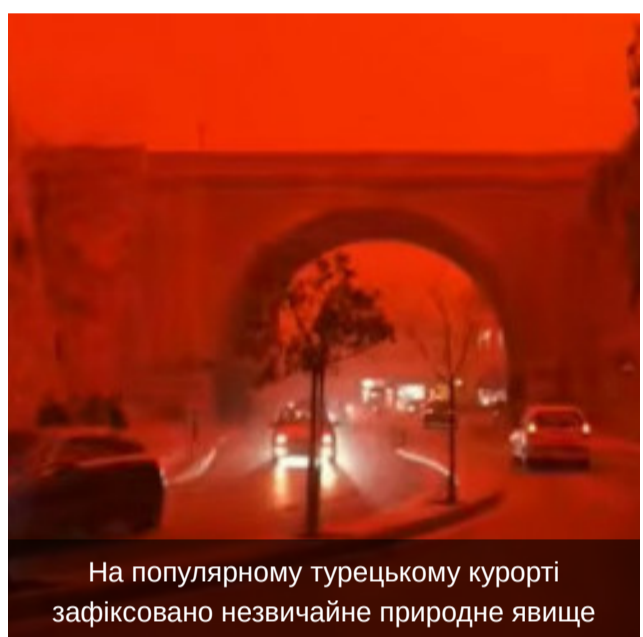
Фото та Відео

На популярному турецькому курорті зафіксовано незвичайне природне явище