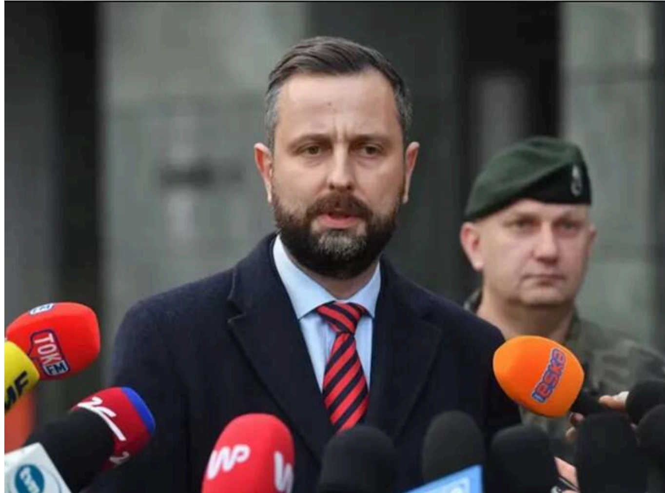
Польща закликала Україну точніше обирати цілі ударів, щоб уникнути ризиків для НАТО

Україна повинна точніше обирати цілі для завдання ударів на території Росії, щоб це не створювало загрози для безпеки країн НАТО, і щоб Росія не використовувала цього для ескалації ситуації і ведення гібридних дій.