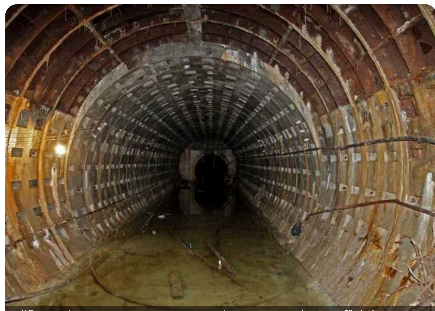
У Павлограді замовили ремонт колектора з дорогим піском та дешевим асфальтом за 52 мільйони гривень

КП «Павлоградводоканал» 8 травня за результатом торгів замовило ТОВ «БК-Новострой» реконструкцію напірного каналізаційного колектора за 52,16 млн грн.