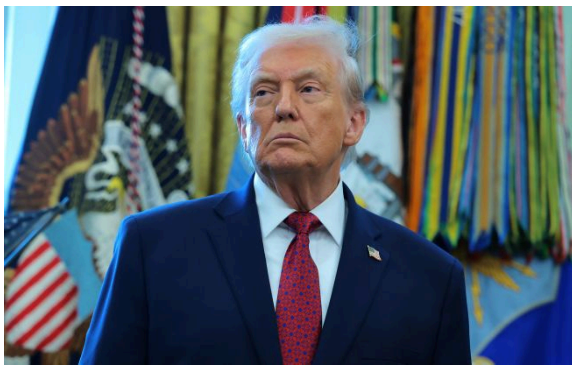
Фото: Дональд Трамп

Вимкни хаос міжнародних новин! Отримуй тільки важливе з РБК-Україна у Google