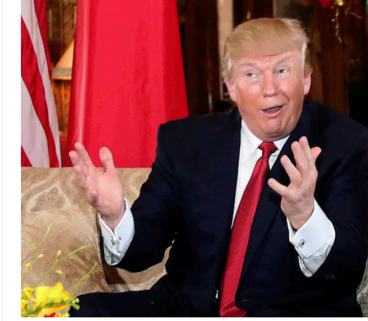
Американський Мін'юст заборонив Податковій службі перевіряти податкові декларації президента США Дональда Трампа та його родини за минулі роки.

Про це пишуть CNN , The New York Times і Politico .