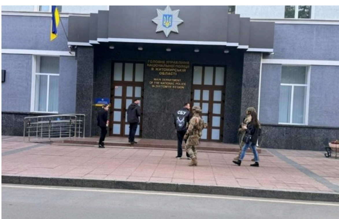
Фото: проведення обшуків у топпосадовців Нацполу (t.me/ruslan_kravchenko_ua)