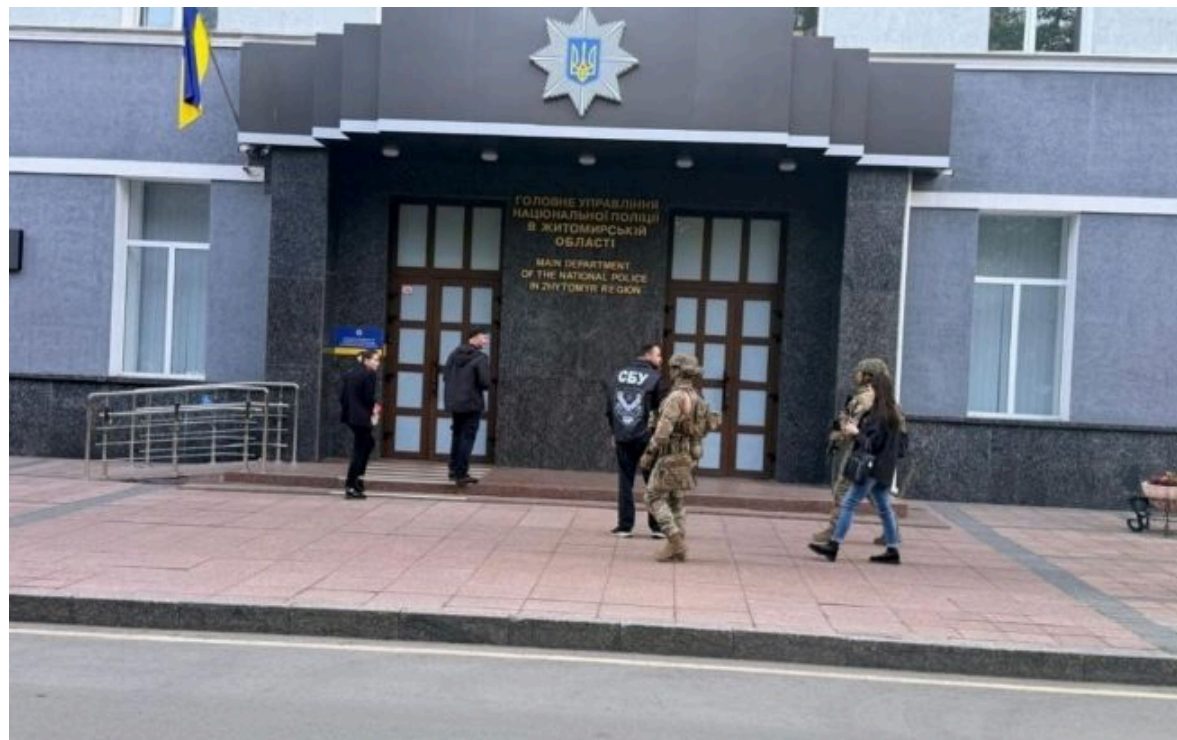
Фото: проведення обшуків у топпосадовців Нацполу

Не витрачай час на шум! Читай тільки суть з РБК-Україна у Google