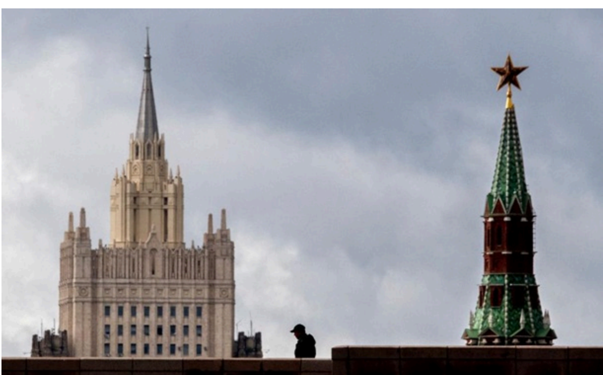
Одна з веж Кремля і будівля МЗС РФ в Москві

У Кремлі планують максимально "розігнати" в українському та європейському просторі медіакампанію з трьох ключових питань.