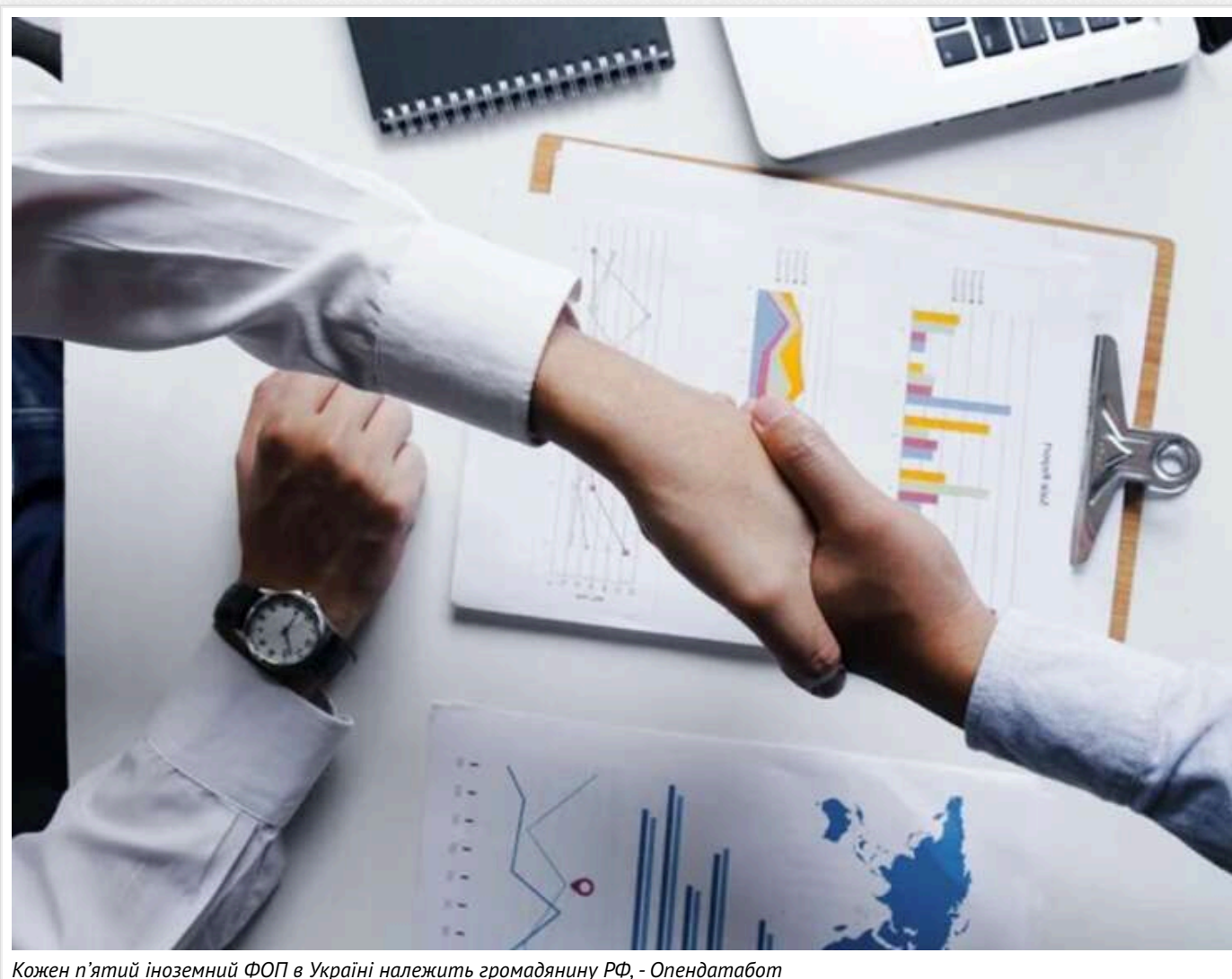
Кожен п'ятий іноземний ФОП в Україні належить громадянину РФ, - Опендатабот

Станом на середину травня 2026 року в Україні офіційно працюють 21 967 приватних підприємців з іноземним громадянством.