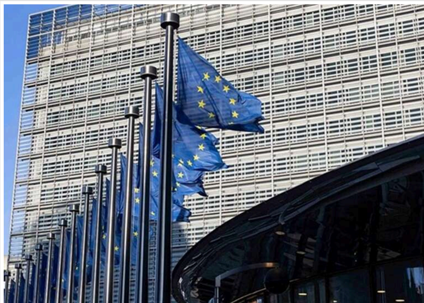
Єврокомісія погодила меморандум про кредит Україні на 90 мільярдів євро з політичними умовами

Єврокомісія уклала меморандум, що визначає порядок і умови надання Україні кредиту в 90 млрд євро.