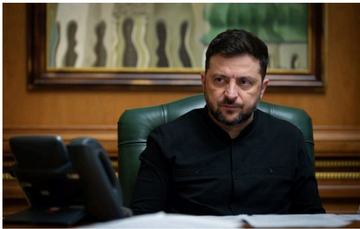
Фото: Володимир Зеленський, президент України (facebook.com_zelenskyy.official)

Не втрачай час на шум! Читай тільки суть з РБК-Україна у Google