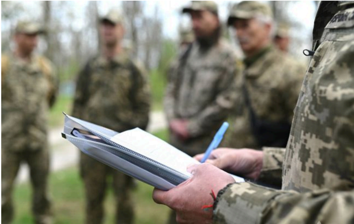
Фото: працівники територіального центру комплектування (facebook.com/CherkasyTCK)

Розумій ситуацію на фронті через факти, а не чутки з РБК-Україна у Google