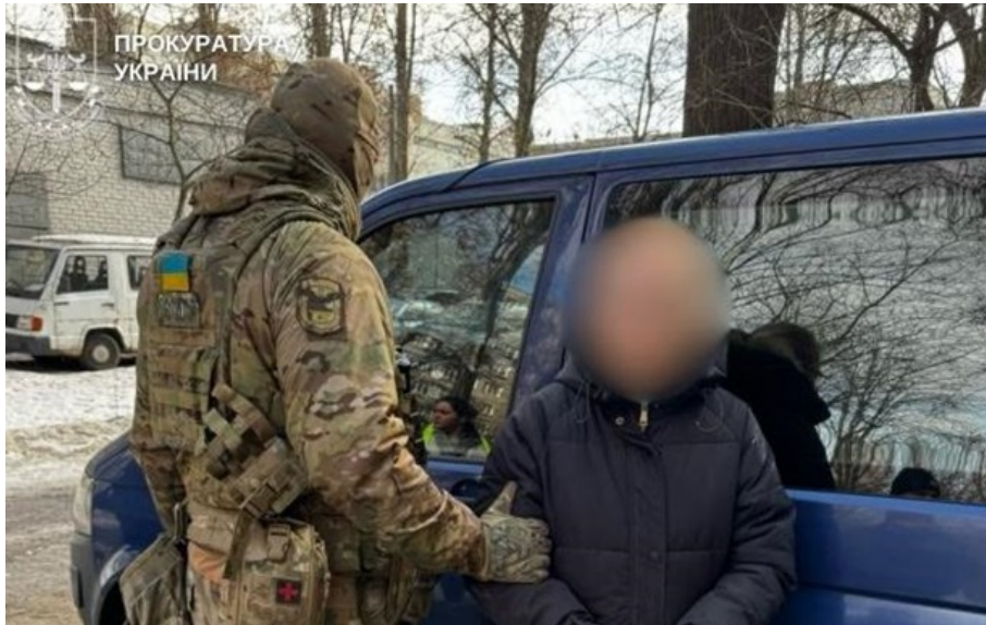
Мужчине также сообщили о подозрении в изнасиловании дочери сожительницы

В рамках расследования получены доказательства изнасилования малолетней дочери фигурантки задержанным.