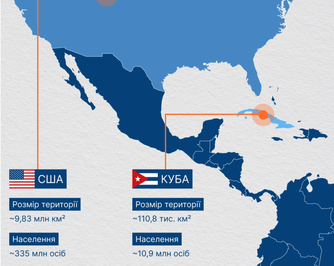
Фото: Загострення між США та Кубою (інфографіка РБК-Україна)

Дональд Трамп досі не спромігся завершити ні агресію Росії проти України, ні власну війну проти Ірану, але вже планує напад на Кубу. Такий сценарій зараз цілком серйозно обговорюють у Білому домі.