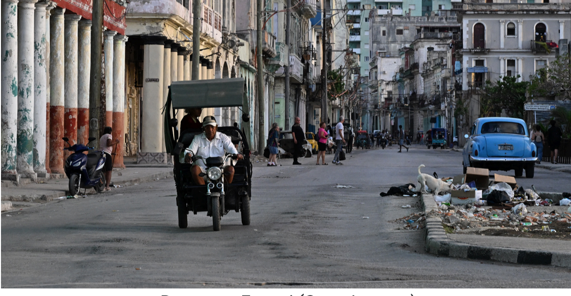
Вулиця в Гавані

Понад 6 мільйонів кубинців підписали офіційні зобов'язання щодо захисту батьківщини за радянською концепцією "Війни всього народу". Вона передбачає перетворення кожного цивільного об'єкта на пункт опору.