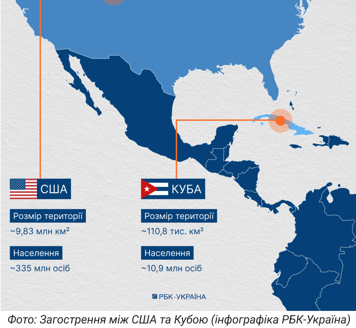
Фото: Загострення між США та Кубою (інфографіка РБК-Україна)

Дональд Трамп досі не спромігся завершити ні агресію Росії проти України, ні власну війну проти Ірану, але вже планує напад на Кубу. Такий сценарій зараз цілком серйозно обговорюють у Білому домі.