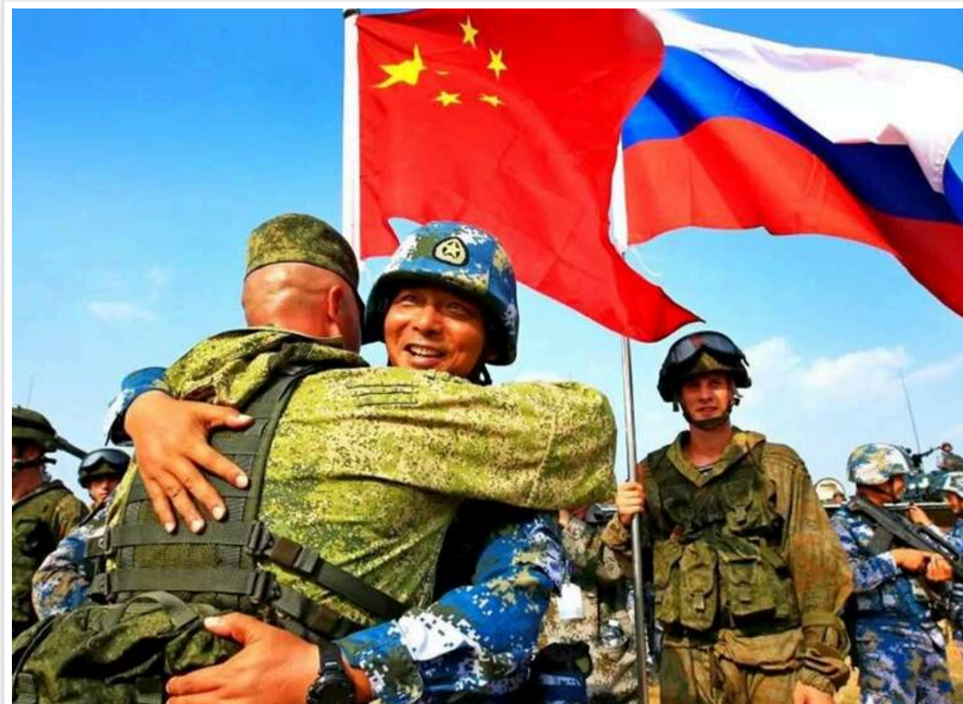
ISW: Китай таємно навчав російських військових тактиці дронів у 2025 році

Народно-визвольна армія Китаю навчала російських військовослужбовців в КНР 2025-го. Це свідчить про те, агресорка РФ і її союзники використовують війну в Україні для військового навчання та випробувань.