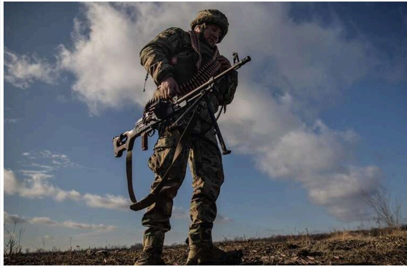
Ситуація на фронті: зафіксовано 38 боєзіткень, найгарячіше – на Покровському та Гуляйпільському напрямках

Від початку доби агресор 38 разів атакував позиції Сил оборони. Тривають артилерійські обстріли прикордонних районів, повідомляє Генштаб ЗСУ.