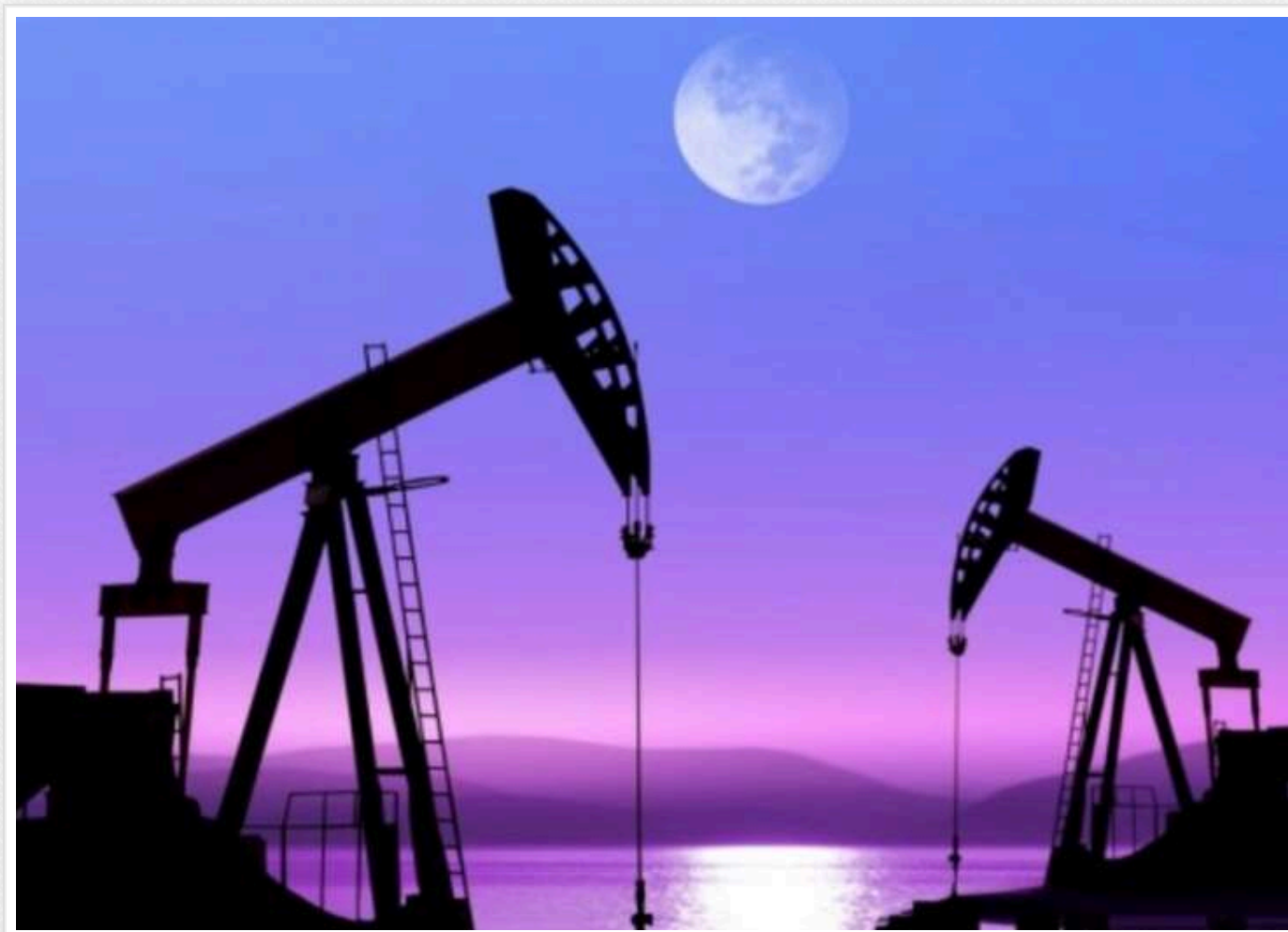
Нафта дешевшає на тлі заяв Трампа про швидке завершення війни з Іраном

20 травня ціни на нафту опустилися після того, як президент США Дональд Трамп знову заявив, що війна з Іраном завершиться "дуже швидко". Водночас інвестори й дали з побоюванням стежать за перспективами мирних перемовин на тлі затяжних перебоїв із постачанням з Близького Сходу.