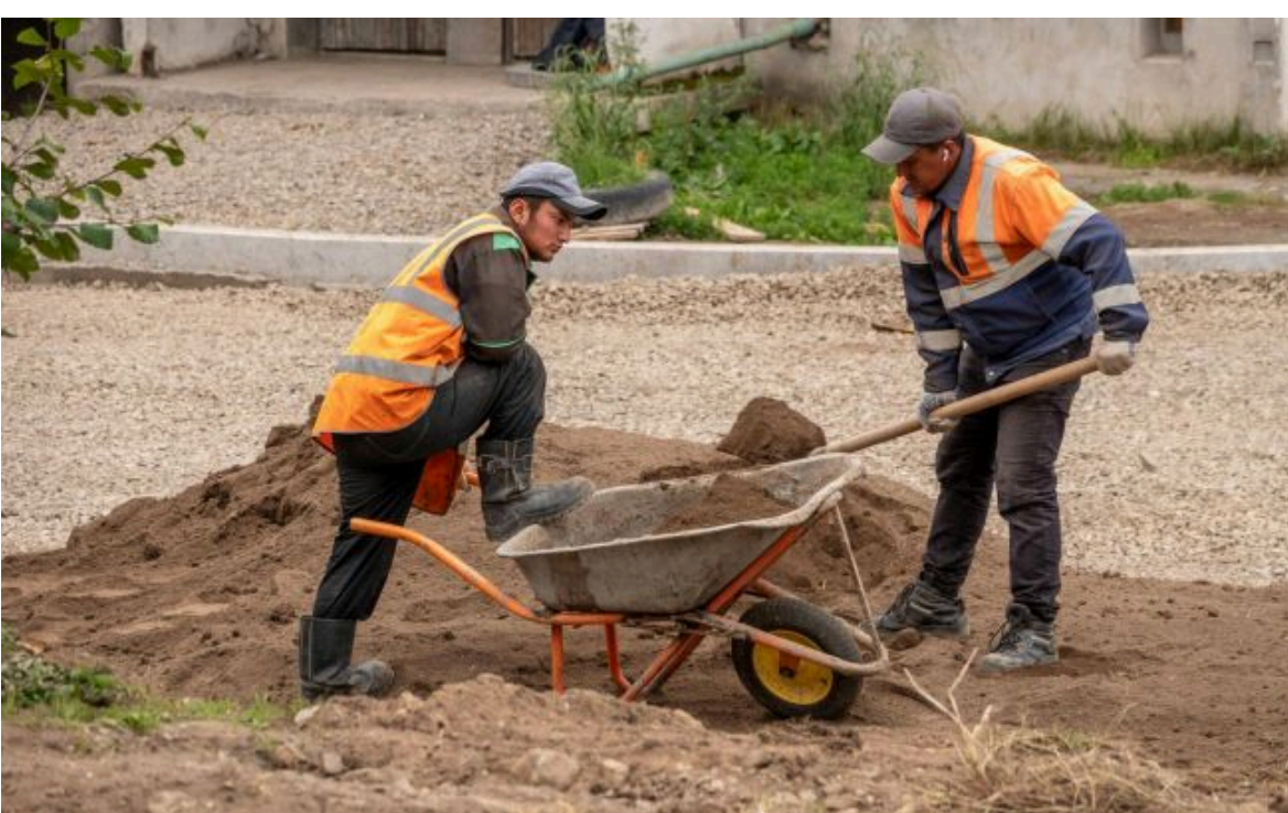
Фото: Трудові мігранти

Не витрачай час на шум! Читай тільки суть з РБК-Україна у Google