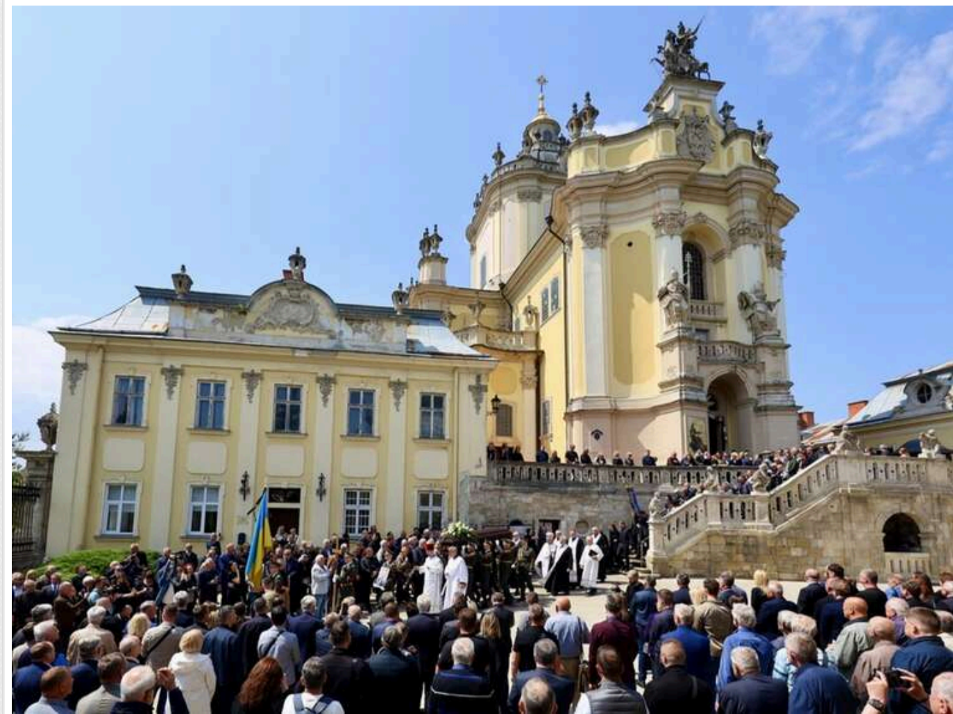
У Львові попрощалися з державним діячем та народним депутатом Степаном Кубівим

20 травня у Львові попрощалися зі Степаном Кубівим — українським політиком та громадським діячем. Віддати шану нардепу прийшли сотні людей: рідні, друзі, колеги, мешканці міста та представники влади.