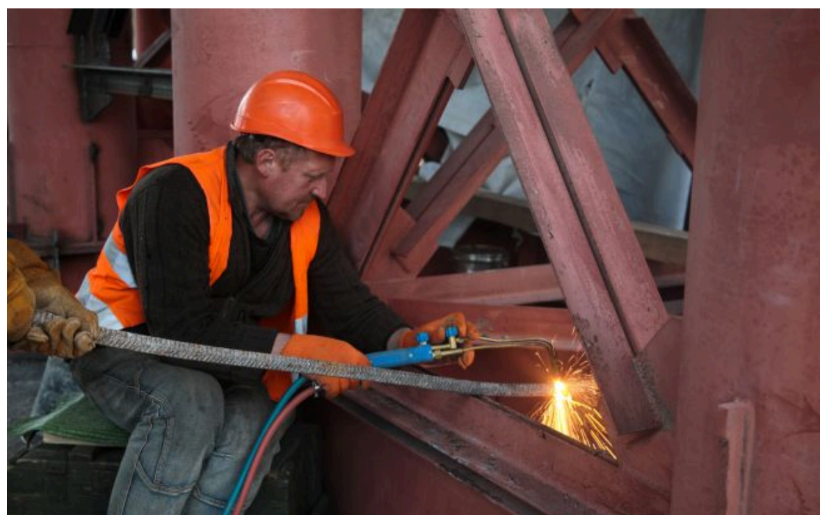
Фото: хвилю страхів про мігрантів розганяють свідомо

🔍 Не витрачай час на шум! Читай тільки суть з РБК-Україна у Google