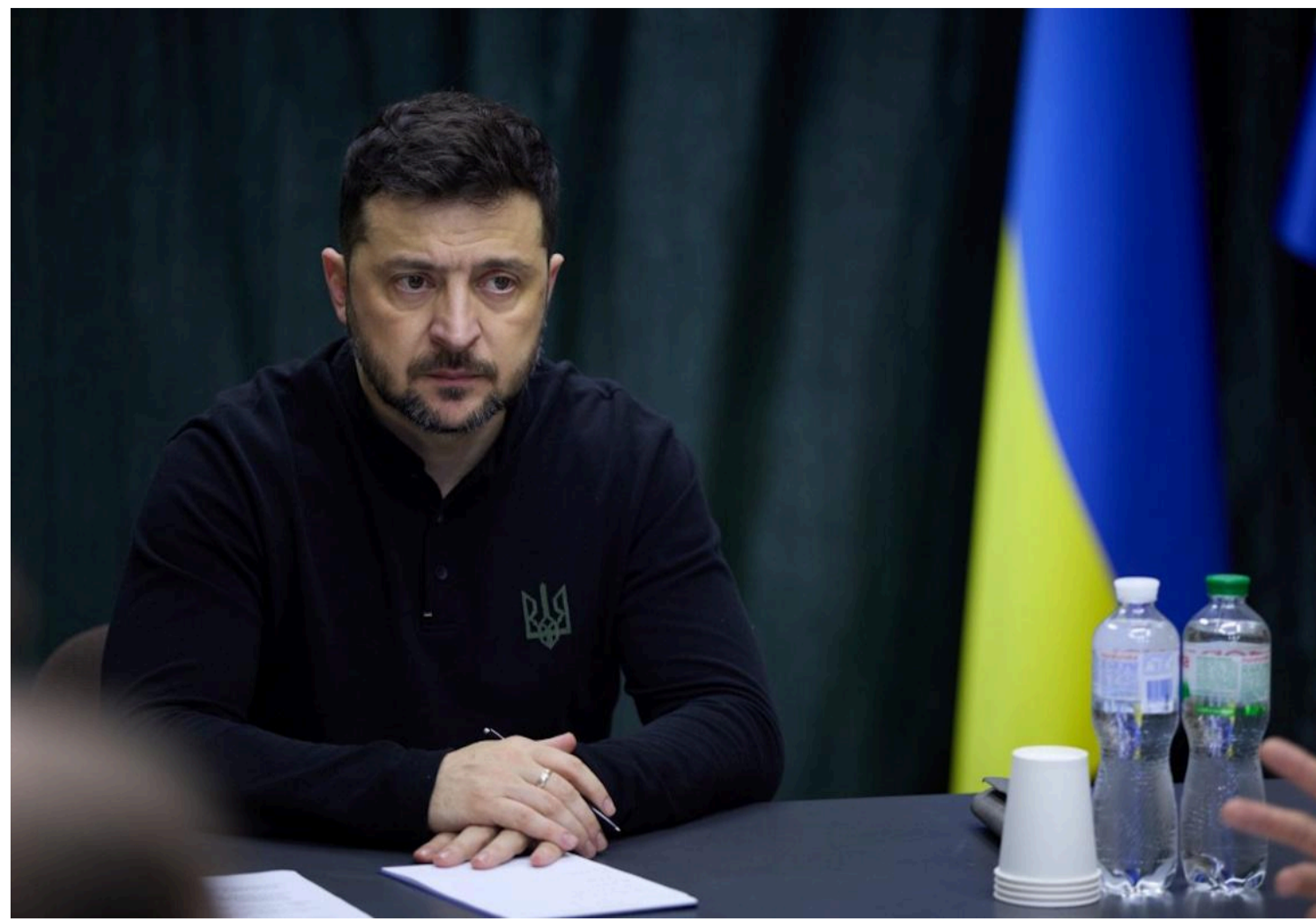
За словами президента, також переглядаються можливості нашої зовнішньої активності

По кожному можливому варіанту дій ворога готують відповіді, якщо росіяни дійсно наважаться розширити свою агресію, заявив Зеленський.