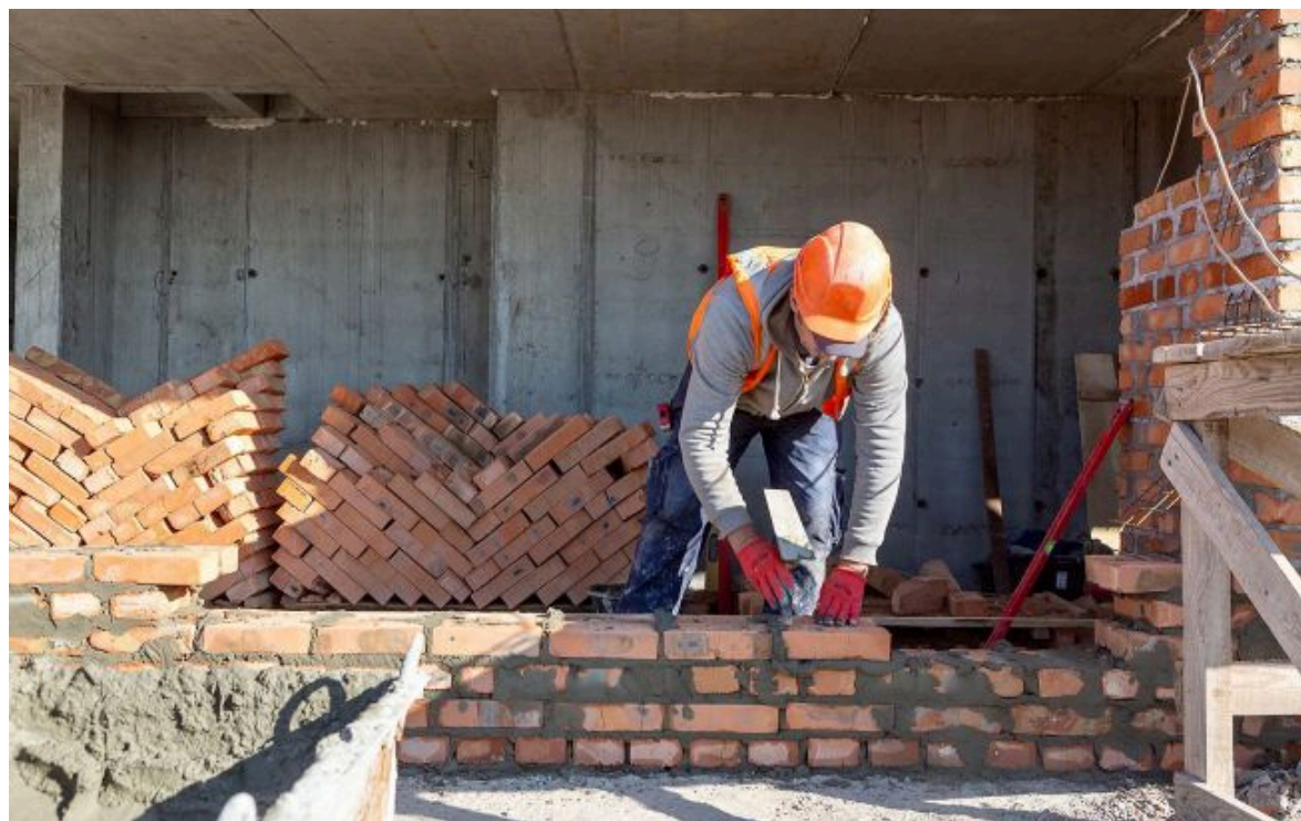
Фото: після війни найбільший брак робочої сили буде у будівництві