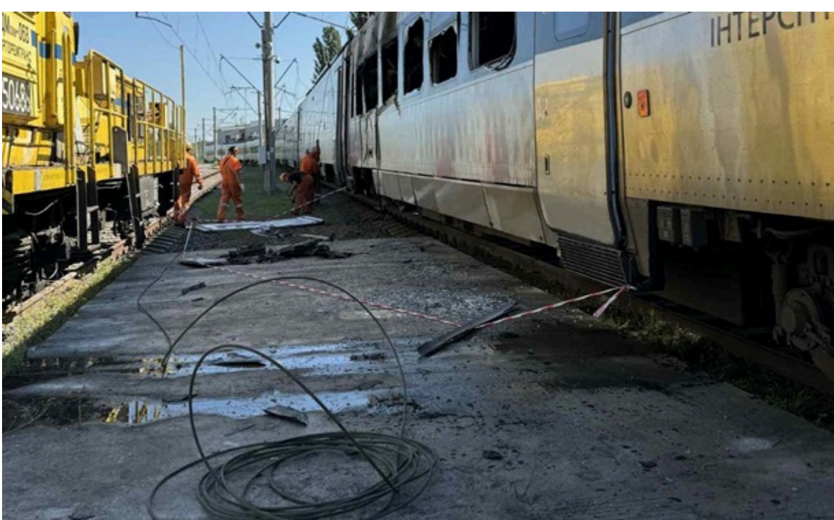
Росія за час війни знищила 46 пасажирських вагонів Укрзалізниці

При виконанні службових обов'язків з початку збройної агресії Росії у 2022 році загинуло 40 залізничників.