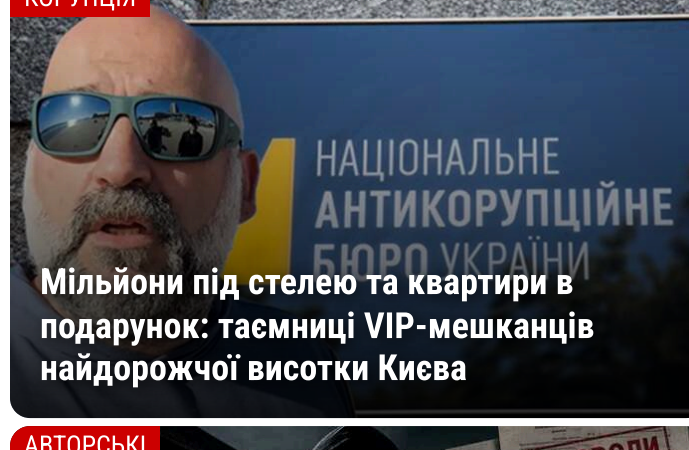
Мільйони під стелею та квартири в подарунок: тасмиці VIP-мешканців найдорожчої висоти Києва