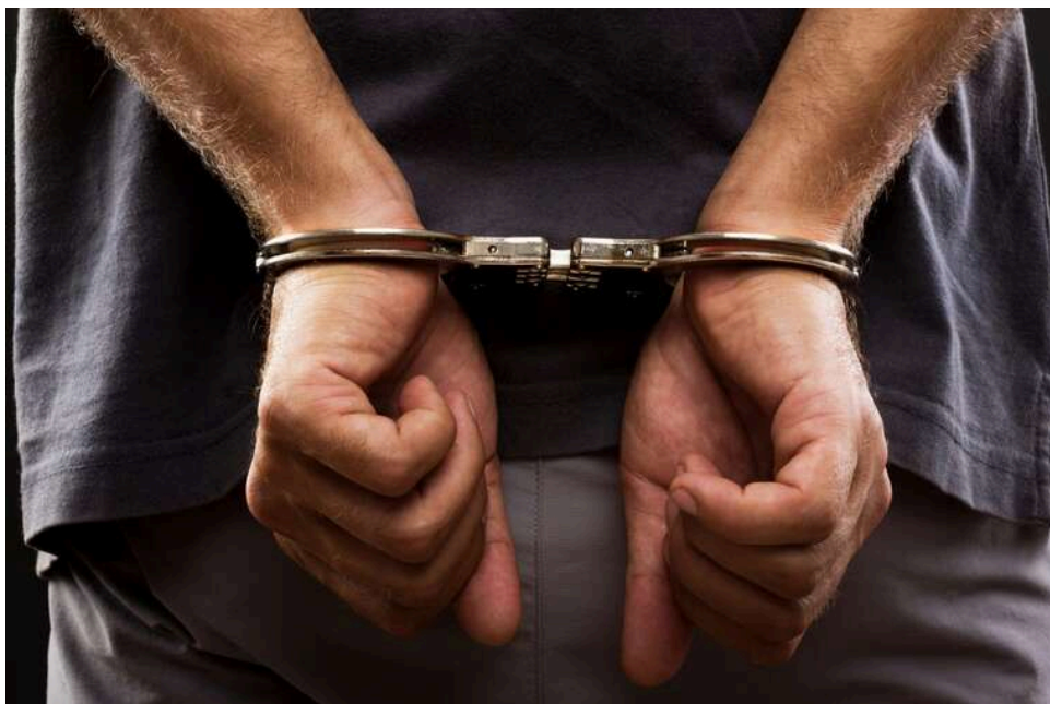
У Києві затримали жінку, яка підозрюється у серії крадіжок у ювелірних магазинах

Слідчі та оперативники Святошинського управління поліції Києва разом із детективами карного розшуку затримали 32-річну мешканку столиці, яка систематично обкрадала ювелірні крамниці в торговельних центрах різних районів міста. Нещодавно столична поліція вже фіксувала крадіжку золота - тоді 58-річний іноземець намагався винести ювелірні прикраси та потрапив прямо в руки правоохоронців. Цього разу зловмисниця діяла під виглядом покупниці: просила показати коштовні вироби, а потім ховала ланцюжки й каблучки до кишені верхнього одягу та спокійно залишала магазин. Правоохоронці встановили щонайменше п'ять епізодів злочинної діяльності, а жінці висунуто підозру за статтею про крадіжку в умовах воєнного стану - їй загрожує до восьми років позбавлення волі.