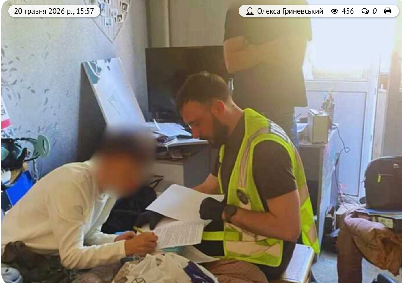
Киянину повідомили про підозру у шахрайстві: ошукав знайому на 700 тисяч гривень

За процесуального керівництва Святошинської окружної прокуратури Києва 20-річному киянину повідомили про підозру у шахрайстві.