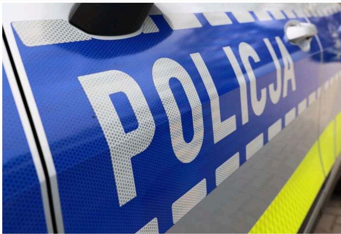
У Варшаві ліквідували нелегальне ескорт-агентство: серед затриманих – громадяни України

Співробітники СВБП провели операцію з припинення діяльності організованої злочинної групи, яка діяла у Варшаві. Слідчі ліквідували нелегальне «ескорт-агентство». Операція відбулася на початку травня у варшавському районі Вавер.