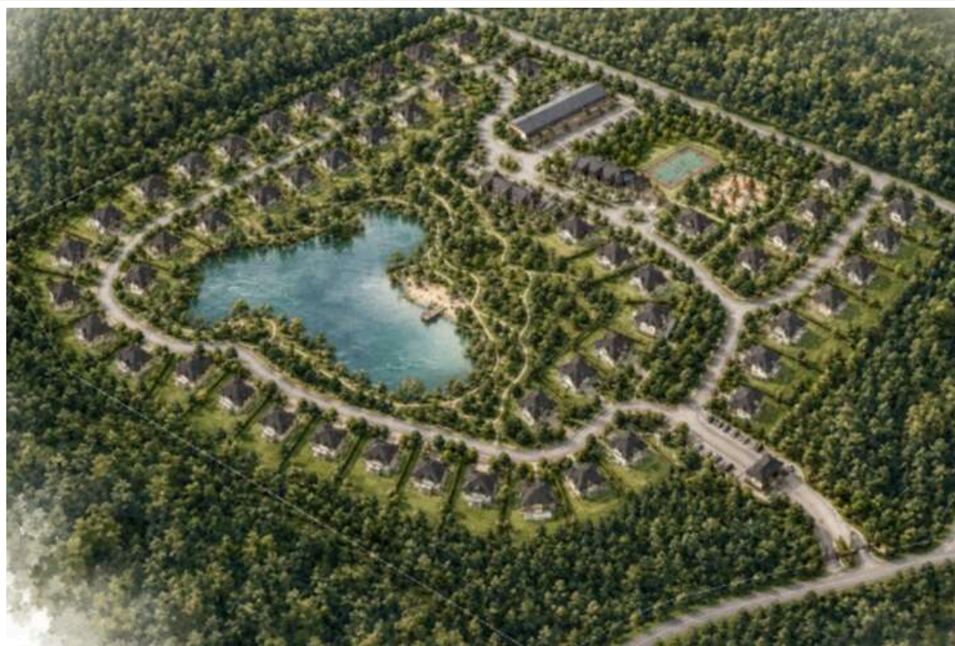
Приватна «державка» у лісі: під Білою Церквою за 2,5 мільйона доларів продають 14 гектарів землі з власним озером

У селі Фурси поблизу Білої Церкви на продаж виставили 14 гектарів землі просто серед лісу. Бонусом до ділянки йде власне озеро, комунікації та промислова інфраструктура. Ціна питання – 2,5 мільйона доларів.