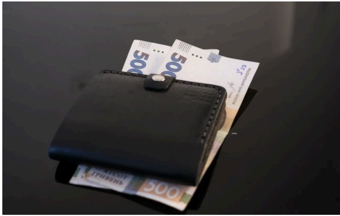
Фото: уряд затвердив розміри разової виплати до Дня Незалежності (РБК-Україна)