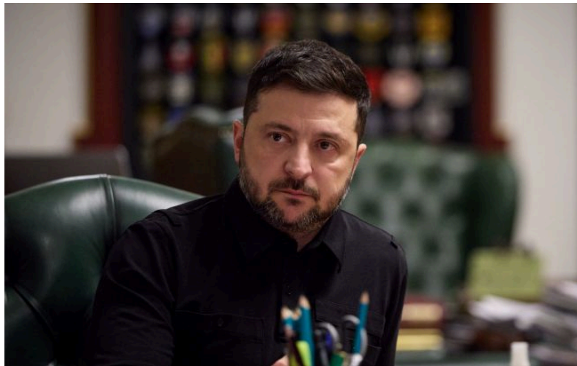
Фото: Володимир Зеленський, президент України (facebook.com_zelenskyy.official)